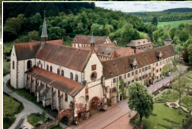
Kloster Bronnbach