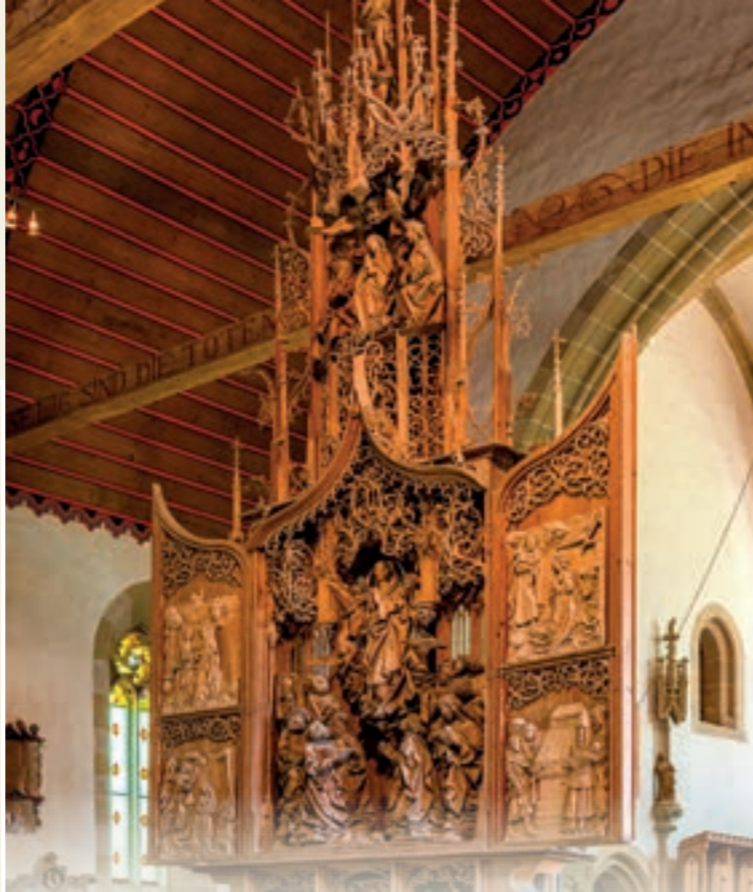
Marienaltar von Tilman Riemenschneider in der Herrgottskirche in Creglingen

Zahlreiche Burgen, Schlösser und Klöster zeugen von der langen Geschichte des Taubertals. Das prachtvolle Renaissanceschloss in Weikersheim, der Marienaltar von Tilman Riemenschneider in Creglingen oder das beeindruckende Kloster Bronnbach bei Wertheim sind nur einige Beispiele. Eine der größten Burganlagen Süddeutschlands, die Burg Wertheim, ist Schauplatz für Konzerte oder Open-Air-Highlights wie das Burgfilmfest. Zu Burgfestspielen lädt die malerische Stadt Freudenberg am Main die Besucherinnen und Besucher auf die Burg Freudenberg ein. Das Kurmainzische Schloss in Tauberbischofsheim mit dem Tauberfränkischen Landschaftsmuseum und dem berühmten Türmersturm auf dem Schlossplatz ist ebenso einen Besuch wert. Nicht zu vergessen sind die zahlreichen Museen der Region, denn das Liebliche Taubertal ist eine eigene Museumswelt für sich. Neben diesen kulturellen Schätzen findet man in den Klostergärten und Schlossparks Oasen der Ruhe.