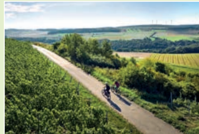
Weinberge Kilsheim