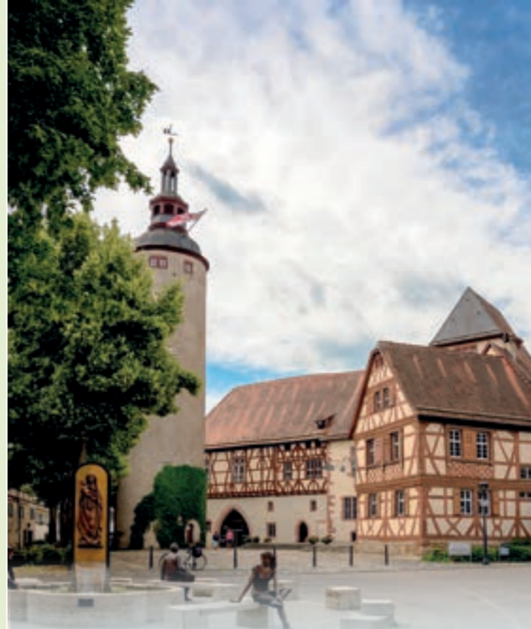
Kurmainzisches Schloss in Tauberbischofsheim

NL Vakwerkhuisen, kastelen en paleizen, heuvelachtige wijngaarden, wilde en romantische natuur en eeuwenoude geschiedenis – het "Lieflijke Taubertal" doet zijn naam eer aan. Het dankt zijn naam aan de rivier de Tauber, die van Rothenburg ob der Tauber in het zuiden tot Wertheim am Main in het noorden kronkelt en met grote bochten door Baden-Württemberg en Beieren stroomt. Met zijn idyllische landschap, historische steden en pittoreske dorpen biedt het Taubertal een schat aan vrijetijdsmogelijkheden en cultuurschatten, zowel tijdens een autorit over de rue romantique als tijdens uitstekende fiets- en wandelroutes.