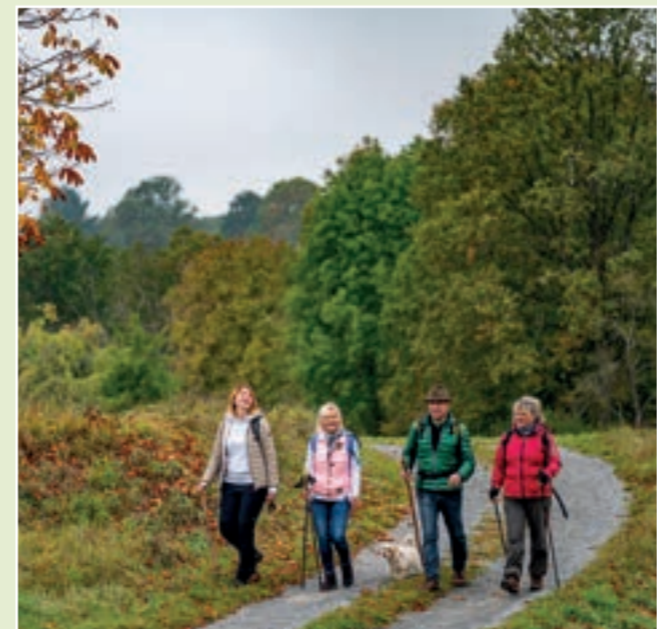
Panoramaweg Taubertal, Foto: Tom Weller

Des nombreux châteaux, palais et monastères témoignent de la longue histoire de la vallée de la Tauber. Le magnifique château Renaissance de Weikersheim, l'autel de la Vierge de Riemenschneider à Creglingen ou l'impressionnant monastère de Bronnbach près de Wertheim ne sont que quelques exemples. L'un des plus grands châteaux forts du sud de l'Allemagne, le château de Wertheim, est le théâtre de concerts ou d'événements en plein air comme le festival du film au château fort, le «Burgfilmfest». La ville pittoresque de Freudenberg am Main invite les visiteurs au château de Freudenberg à l'occasion de festivals au château fort. Le château de Kurmainz à Tauberbischofsheim, avec son musée du paysage tauber-franconien et la célèbre tour «Türmersturm» sur la place du château, vaut également le détour. Il ne faut pas non plus oublier les nombreux musées de la région, car la Vallée du Tauber est un monde de musées en soi. En plus de ces trésors culturels, on trouve un havre de paix dans les jardins des monastères et les parcs des châteaux.