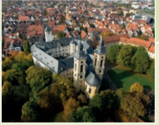
Residenzschloss Mergentheim