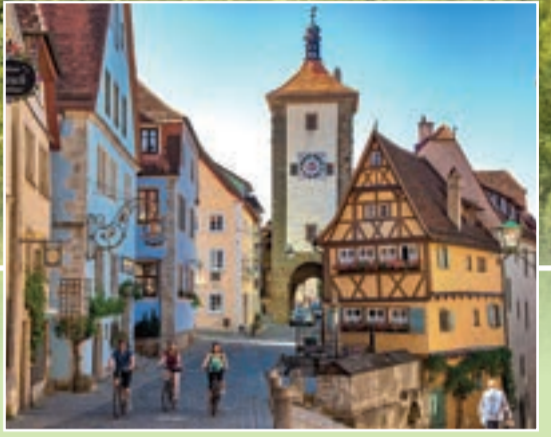
Plänlein, Rothenburg ob der Tauber, Foto: Tom Weller