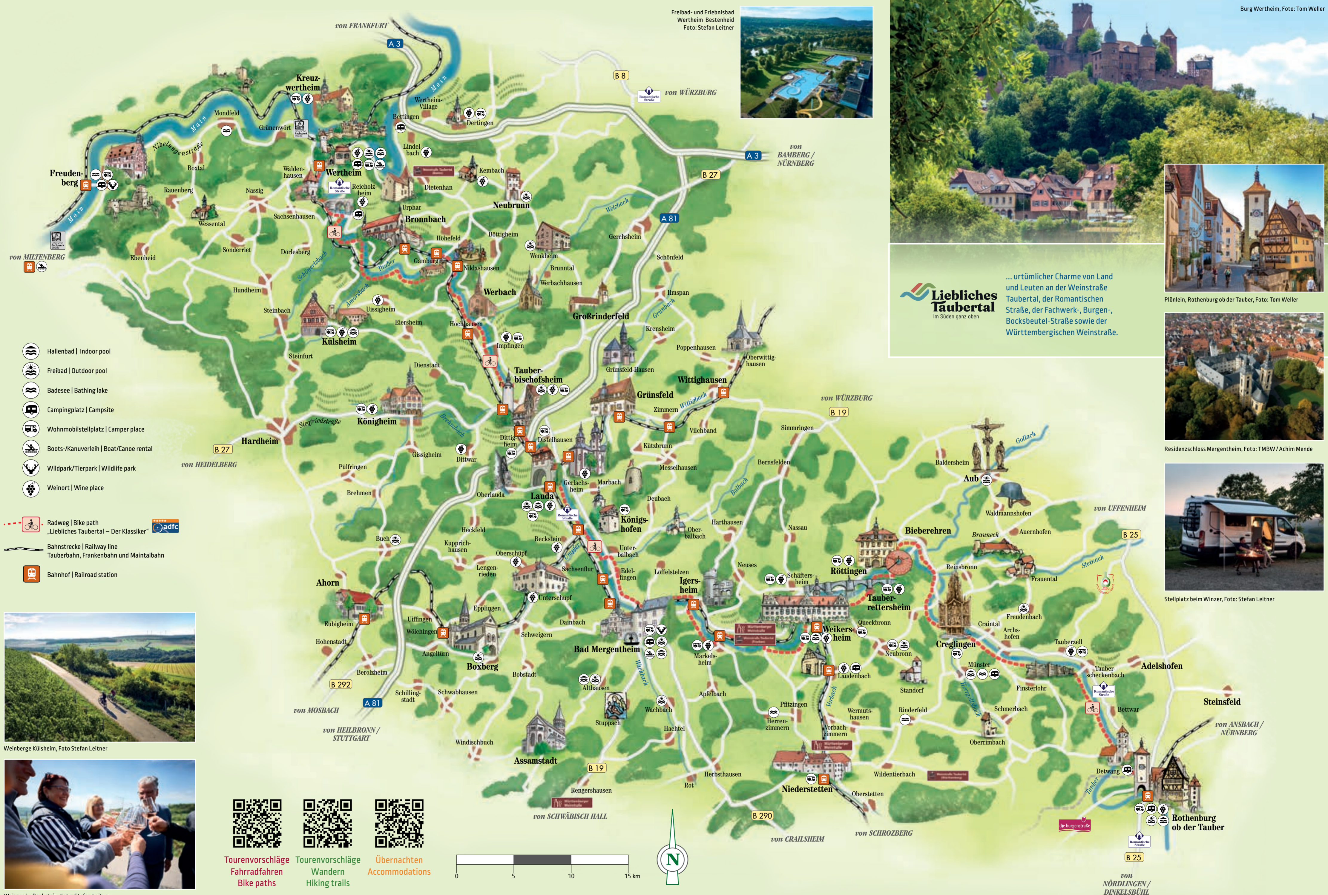
Freibad- und Erlebnisbad Wertheim-Bestenheid