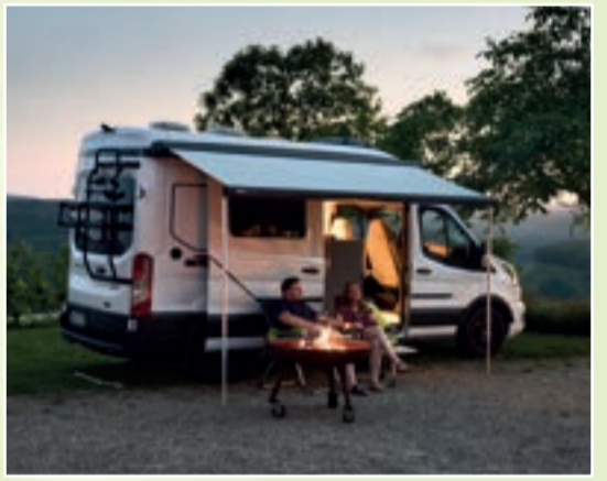
Stellplatz beim Winzer