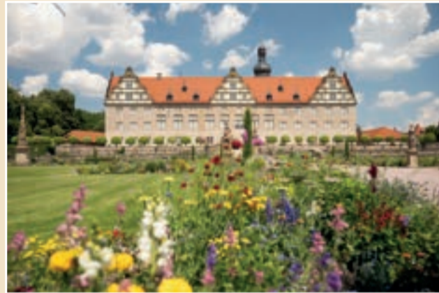
Renaissanceschloss mit Park und Orangerie in Weikersheim

DE Fachwerk, Burgen und Schlösser, hügelige Weinberge, wildromantische Natur und eine jahrhundertalte Geschichte, das Liebliche Taubertal macht seinem Namen alle Ehre. Denn es verdankt seinen Namen dem Fluss Tauber, der sich von Rothenburg ob der Tauber im Süden bis nach Wertheim am Main im Norden schlängelt und in weiten Bögen mal durch Baden-Württemberg, mal durch Bayern fließt. Mit seiner idyllischen Landschaft, historischen Städten und malerischen Dörfern bietet das Taubertal eine Fülle von Freizeitmöglichkeiten und kulturellen Schätzen, ob auf einem Roadtrip entlang der Romantischen Straße oder auf ausgezeichneten Rad- und Wanderrouten.