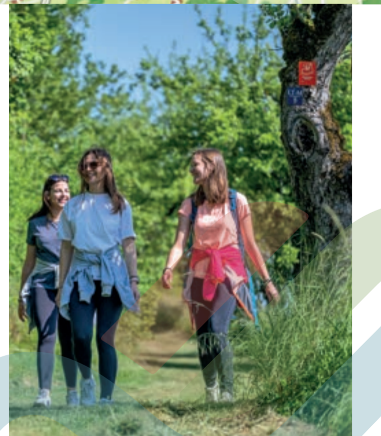
Panoramaweg Taubertal, Foto: Tom Weller