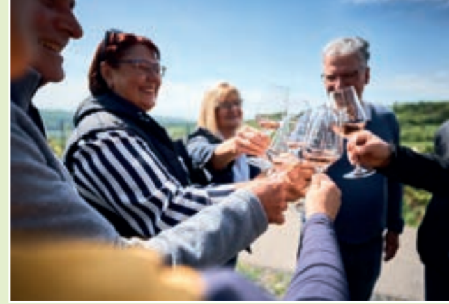
Weinprobe Beckstein, Foto: Stefan Leitner